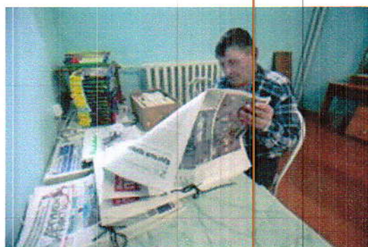
(фото 6 «Библиотека интерната»)

Интернат рассчитан на 401 место. Сейчас содержится 415–420 пациентов. Попадают сюда люди по путёвкам от соцзащиты. Часть – из мест лишения свободы. (см. фото 5). Режим в интернате не закрытый полностью от внешнего мира: при условии соблюдения правил внутреннего распорядка любой пациент может получить разрешение на выход. У жителей интерната есть своя библиотека (см. фото 6), спортзал, бильярдная. В 2013 году в интернат поступили 64 человека. В этом году 2014 уже поступили десять человек... В коридорах и комнатах интерната царят уют и покой (см. фото 7, 8).