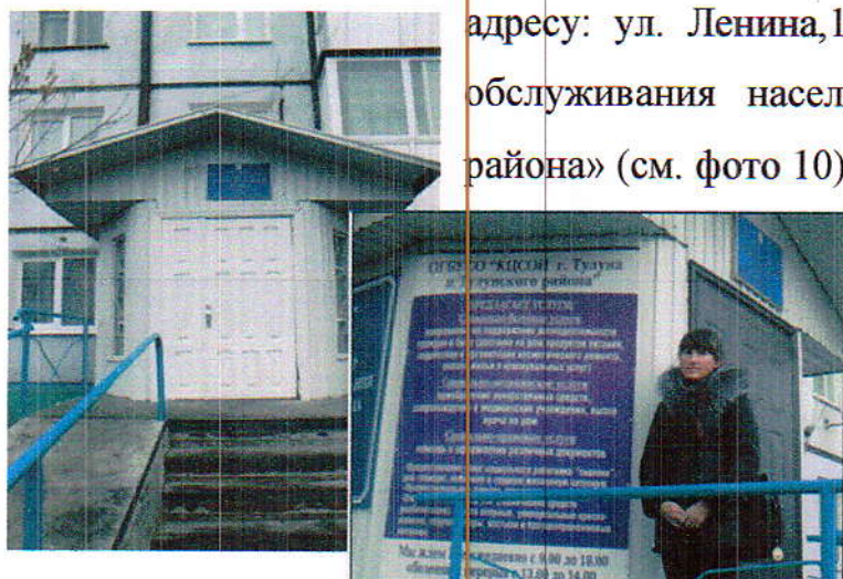
(фото 10 «Комплексный центр социального обслуживания населения города Тулуна и Тулунского района»)

Тулунский комплексный реабилитационный центр расположен по адресу: ул. Ленина, 19 «Комплексный центр социального обслуживания населения города Тулуна и Тулунского района» (см. фото 10).