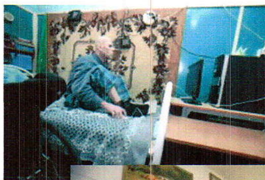
(фото 7, 8 «Уютно как дома»)

Содержание одного человека в месяц составляет 19000 рублей.