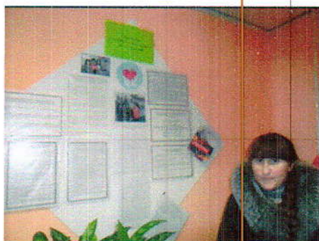
(фото 12 «Уголок социальной помощи»)

В центре расположен «Уголок» социальной помощи», где нуждающиеся могут узнать о предоставляемых услугах (см. фото 12)