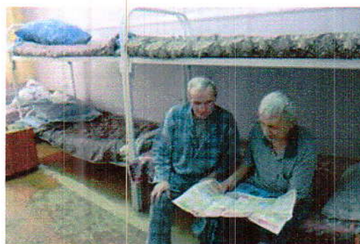
(фото 9 «Жизнь в братском социальном Центре»)

Приангарья, в том числе, для иностранных граждан, проживающих в регионе.