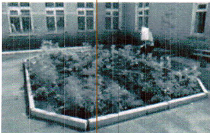
(фото 4 «Шелеховская социальная гостиница»)

Котовского. Полное название организации – областное государственное учреждение социального обслуживания, комплексный центр социального