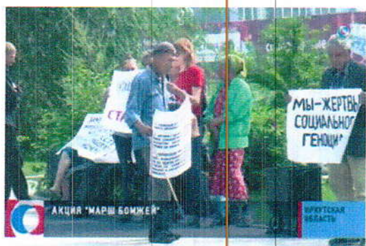
(фото 3 «Марш бомжей»)

В Иркутске проходил «марш бомжей» (см. фото 3). Бездомные люди специально собрались в самом гламурном квартале города «130-й квартал», чтобы привлечь к себе больше внимания. Собравшихся беспокоило не