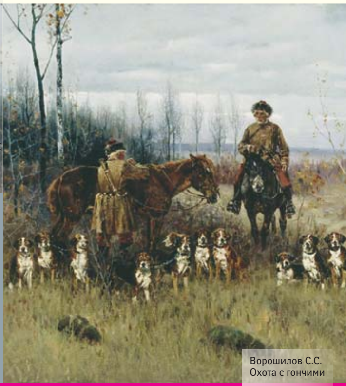
Ворошилов С.С. Охота с гончими