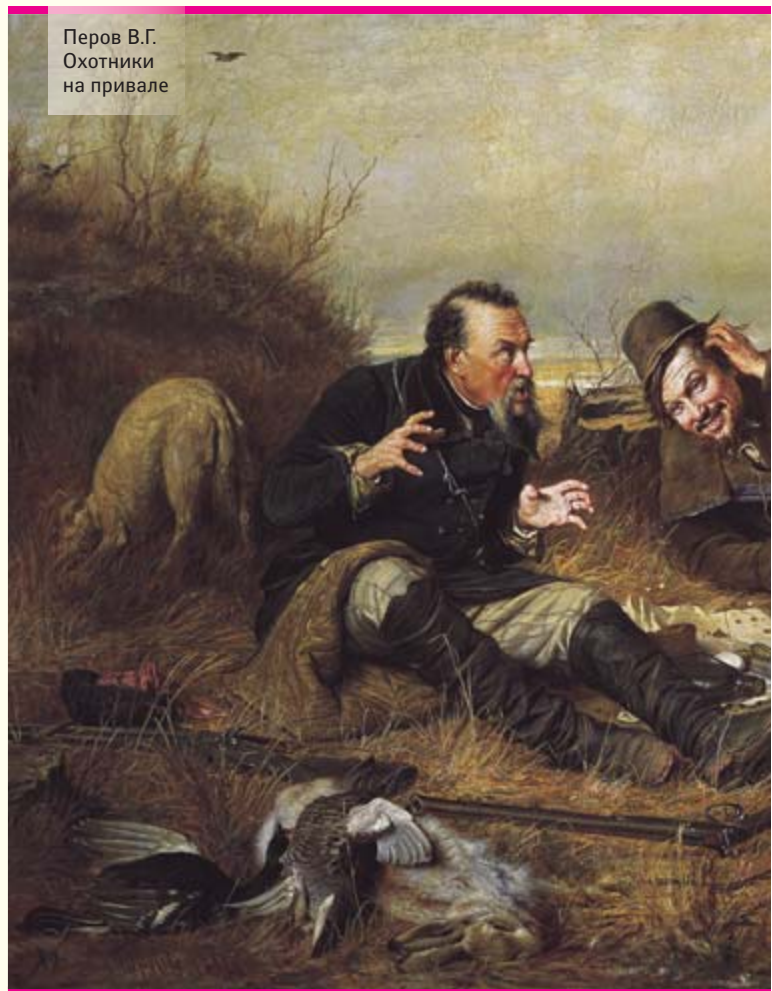
Перов В.Г. Охотники на привале