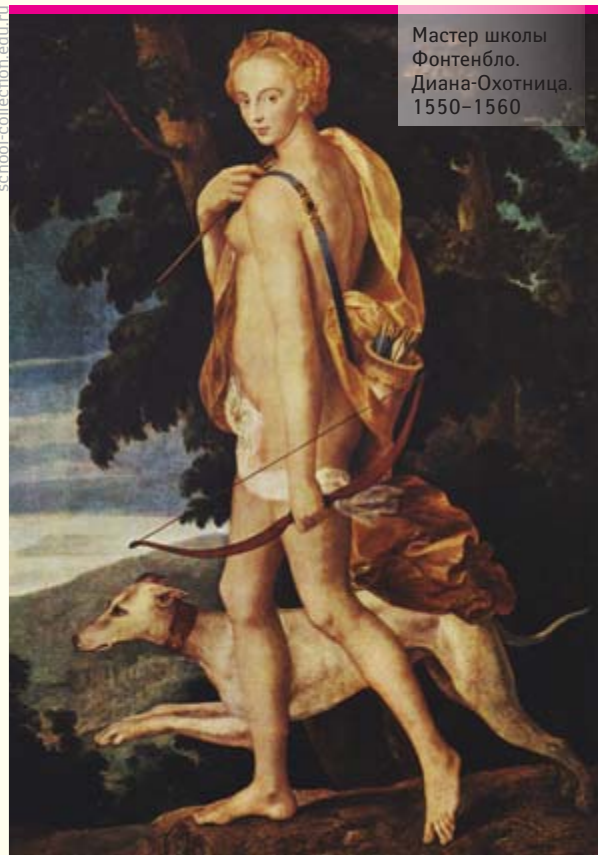
Мастер школы Фонтенбло. Диана-Охотница. 1550–1560