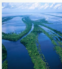
Амазонка — река с самым большим бассейном, по площади равным Австралии