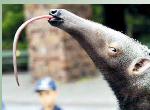
Муравьед — животное Ю. Америки с самым длинным языком (60 см)