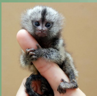
Игрунка — самая маленькая обезьянка на планете