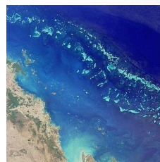
Большой Барьерный риф — самый длинный архипелаг, созданный живыми организмами