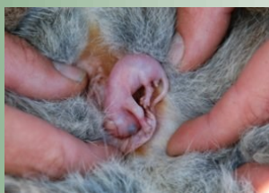
Кенгуру — животное, рождающее самого маленького детеныша (весом 1 г)