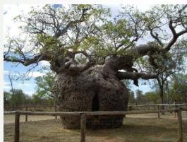
Баобаб — африканское дерево-долгожитель (живет до 5000 лет)