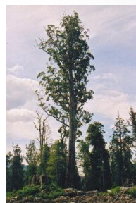
Эвкалипт — самое высокое дерево планеты (200 м)