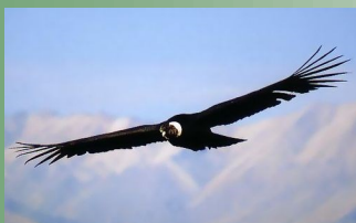
Кондор — самая большая летающая птица с размахом крыльев 3 м