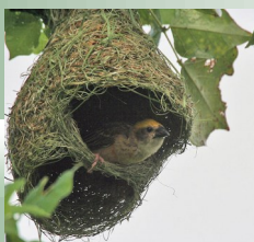
Общественные ткачики — под их гнездами, как под зонтом, могут укрыться 6-7 человек