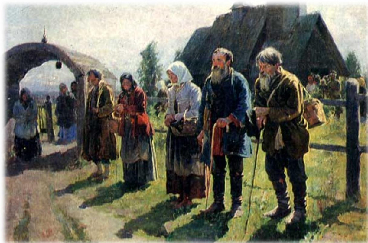
«Нищие». Картина С.А.Виноградова

Об отмене крепостного права всерьез начали размышлять еще в конце XVIII века. Самые разные слои общества считали, что рабство позорит империю в глазах мировой общественности. Чтобы встать в один ряд с европейскими странами, перед правительством России назрел вопрос об отмене крепостного права.