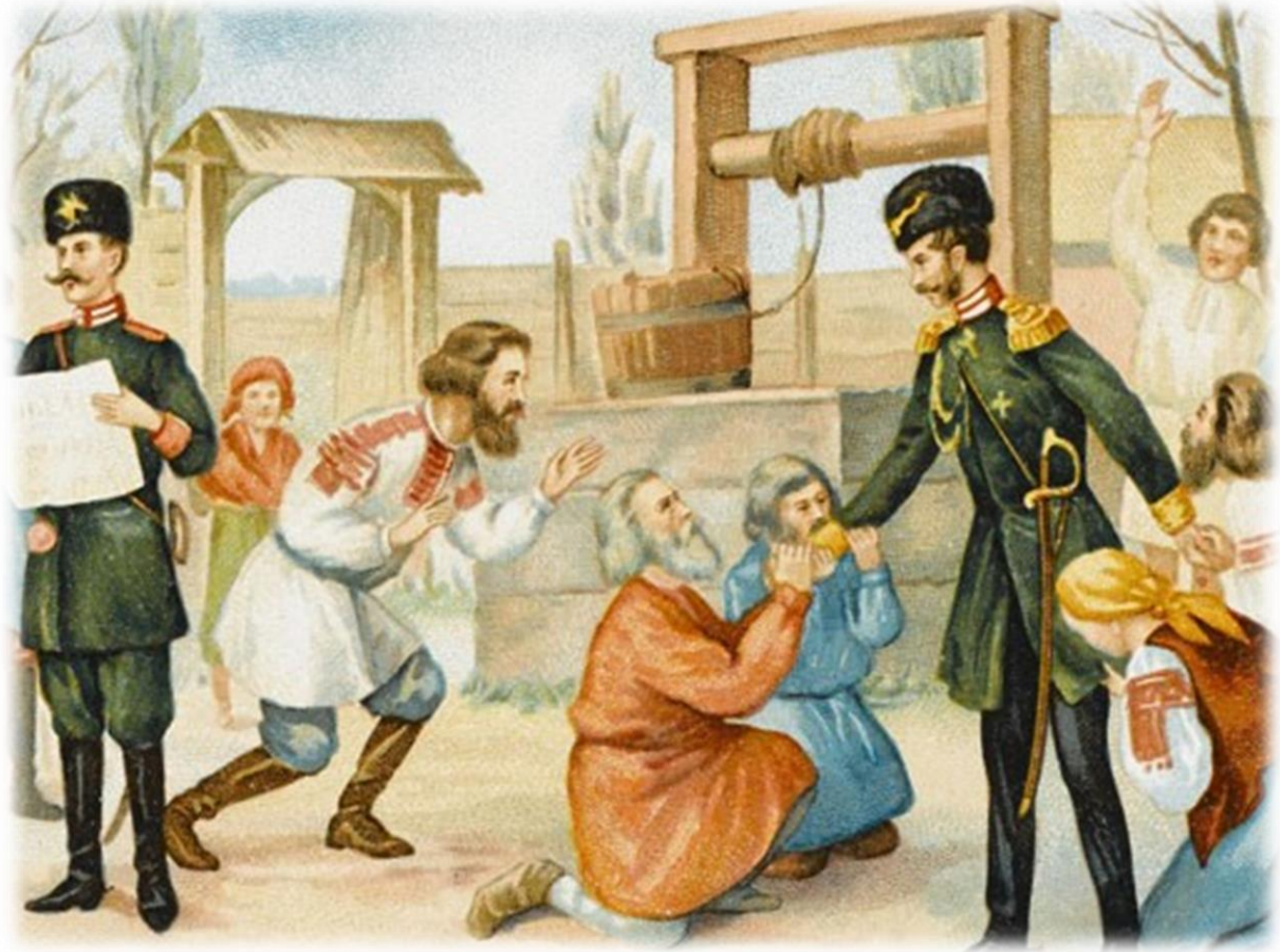
Известие об отмене крепостного права

Хотя освобождение от рабства давало крестьянам некоторые личные и гражданские свободы такие, как право вступать в брак, обращаться в суд, вести торговлю, поступать на гражданскую службу и т.п., но они были ограничены в свободе передвижения, а также в экономических правах. К тому же крестьяне оставались единственным сословием, которое несло рекрутскую повинность и могло подвергаться телесным наказаниям.